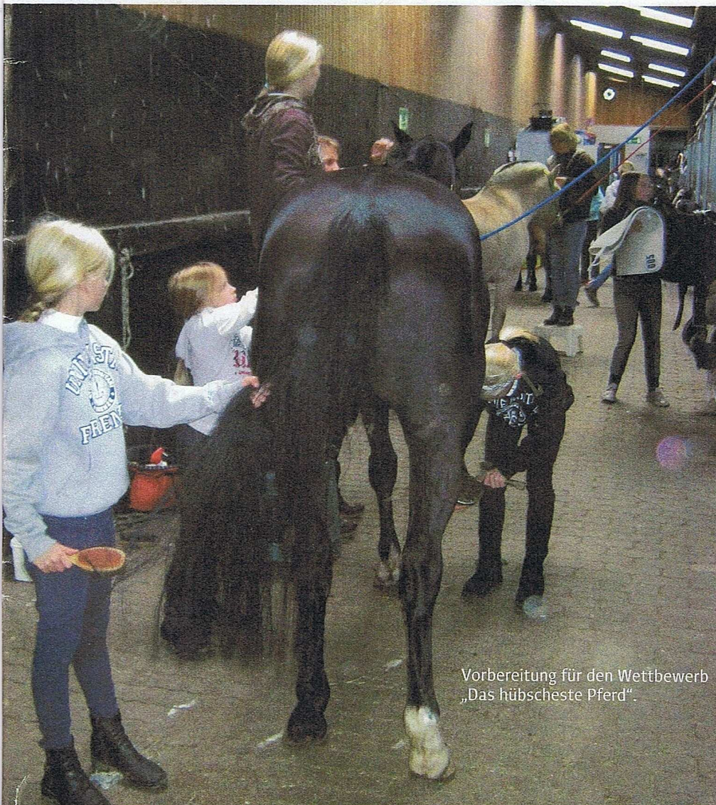
Vorbereitung für den Wettbewerb „Das hübscheste Pferd“.